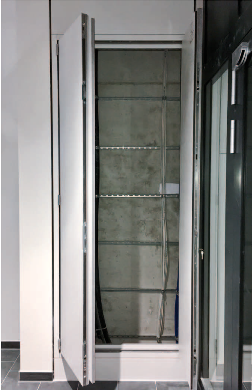
Feuerwiderstandsfähige Einhausung der Elektrosteigleitung

Feuerbeständige Brandlastdämmung der Elektrosteigleitung