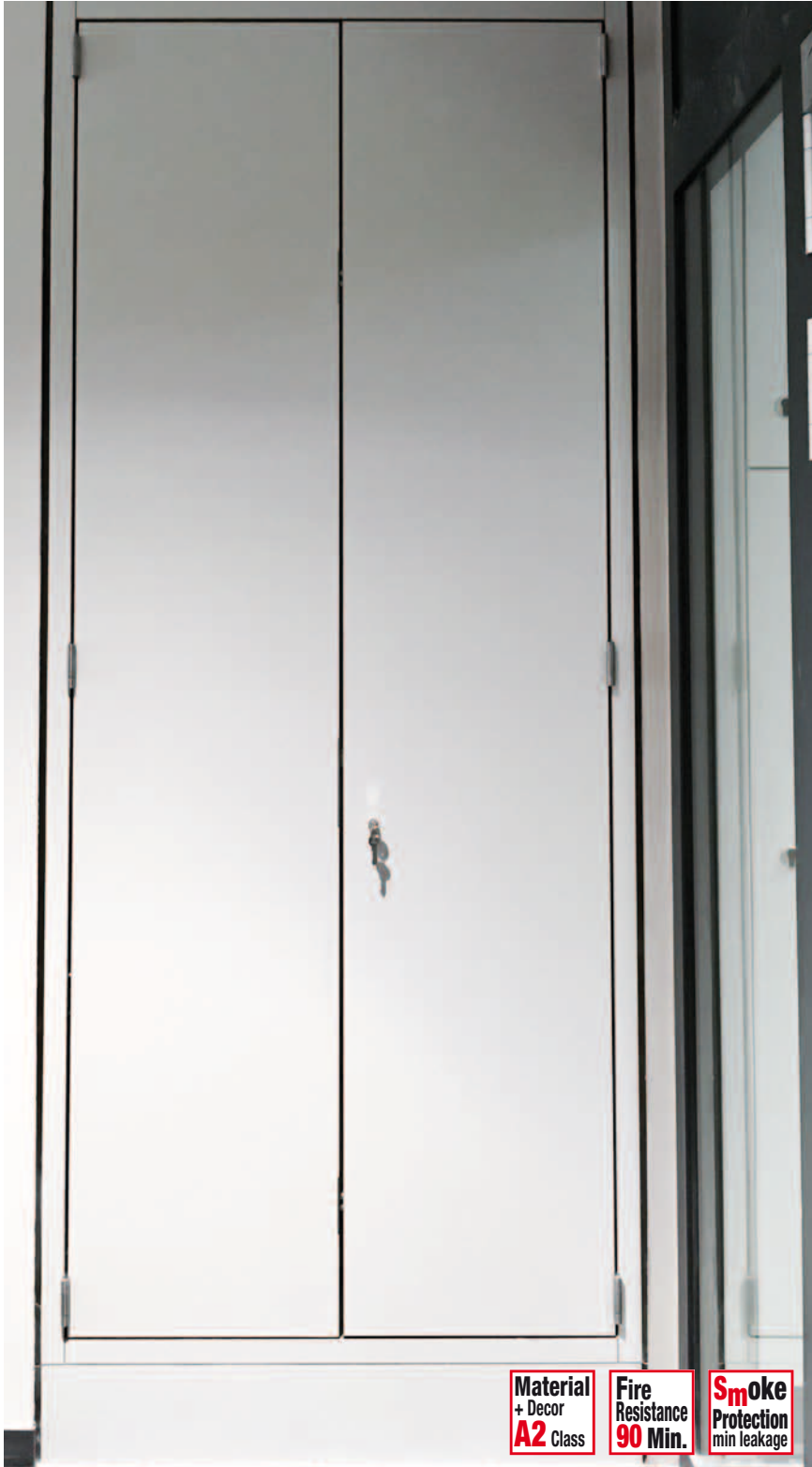
Feuerwiderstandsfähige Einhausung der Elektrosteigleitung

Feuerbeständige Brandlastdämmung der Elektrosteigleitung